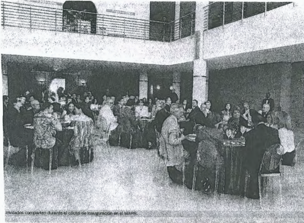
Invitados comparten durante el cóctel de inauguración en el MAPR.