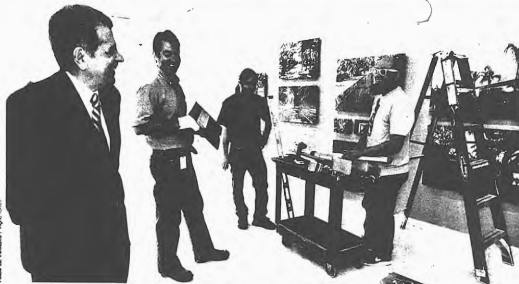
La exposición incluye fotos de la historia entrelazada del Tribunal Supremo y el parque Luis Muñoz Rivera, donde se encuentra la sede del tribunal.

Esta exposición es dedicada al fenecido arquitecto Miguel Ferrer Rincón, uno de los arquitectos más destacados en el País