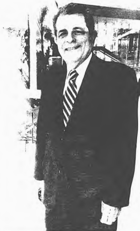
El juez presidente del Tribunal Supremo presentó la exposición 'Contextos' en el vestíbulo de la nueva Biblioteca.