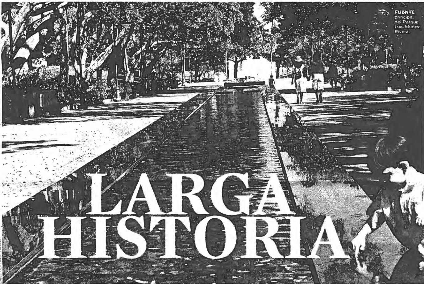
FUENTE principal del Parque Luis Muñoz Rivera.